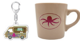
「珈琲いかがでしょう」 アクリルキーホルダー(たこカー) マグカップ