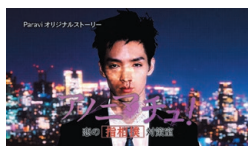
「アノニマチュ〜恋の指相撲対策室〜」

「ドラマParavi」作品をはじめ、テレビ東京の多くのドラマを配信しています。この1年で話題を集めたドラマ「共演NG」や「アノニマス〜警視庁“指殺人”対策室〜」「珈琲いかがでしょう」では、Paraviオリジナルストーリーも独占配信。テレビ放送と配信サービスを並行して楽しめるということで、好評を博しています。