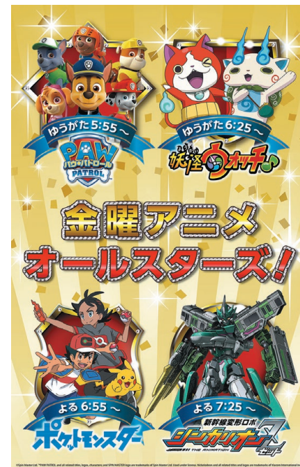
©Spin Master Ltd. PAW PATROL and all related titles, logos, characters; and SPIN MASTER logo are trademarks of Spin Master Ltd. Used under license. Nickelodeon and all related titles and logos are trademarks of Viacom International Inc. ©LEVEL-5/妖怪ウォッチプロジェクト・テレビ東京 ©Nintendo・Creatures・GAME FREAK・TV Tokyo・ShoPro・JR Kikaku ©Pokémon ©プロジェクトシンカリオン・HER-JECWK/超進化研究所Z・TX

テレビ東京では、月曜から日曜まで毎日欠かさずアニメを放送中。なかでも、2021年4月クールより、テレビ東京系列の金曜夕方5時55分から夜7時55分までの2時間は、人気アニメ4番組「金曜アニメオールスターズ！」が彩ります。夕方5時55分からは、個性豊かな子犬たちが様々なトラブルに立ち向かう「PAW・パトロール」でスタート。夕方6時25分からは、主人公のケータがウィスパー、ジバニャン、コマさんなど、個性豊かな妖怪たちと繰り広げるちょっぴり奇妙な物語「妖怪ウォッチ♪」。続いて夜6時55分からは、ポケモンバトルで最強を目指す少年“サトシ”と、すべてのポケモンをゲットするという夢を持つ少年“ゴウ”の冒険を描いた「ポケットモンスター」。そして夜7時25分からは、新幹線が変形する巨大ロボット「シンカリオン」とその運転士となる少年たちの活躍を描く「新幹線変形ロボシンカリオンZ」を放送中です。金曜夕方からは、テレビ東京のアニメで決まり！子どもから大人まで楽しめる、テレビ東京のアニメ番組にご注目ください。