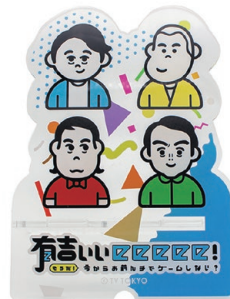
「有吉い eeeee!」 アクリルスマホスタンド

「テレ東本舗.WEB」は番組グッズやDVD、Blu-rayなどを販売しているネット通販サイトです。おなじみの「出川哲朗の充電させてもらえませんか?」「シナぷしゅ」「有吉い eeeee! ~そうだ! 今からお前チでゲームしない?」といった人気番組や話題のドラマのグッズなどを広く取り揃えています。今後も番組をより楽しんでいただけるような商品展開を目指してまいります。